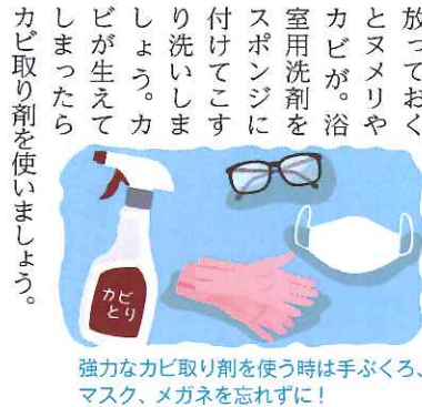
強力なカビ取り剤を使う時は手ぶくろ、マスク、メガネを忘れずに！

浴槽のお手入れでいちばん効果的なのは最後の人が入浴したら、お湯を抜き、お湯の温もりが残っているうちにスポンジに石けんをつけて洗うこと。湯あか防止になりますし、ニオイ対策にもなります。落ちにくい汚れは浴室用洗剤で洗い、よく水で流しましょう。風呂フタは、湯船の湿気を直接受けるのでこちらも