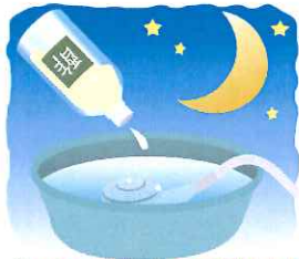
シャワー噴き出し口の目詰まりがひどいときは酢を入れた水にひと晩つけ置きして水で流し、洗剤で軽く仕上げ洗いを！

も日ごろから循環フィルターを外して歯ブラシなどで髪の毛や湯あかをとり除きましょう。洗面器など小物類を一気にキレイにするなら、お風呂の残り湯に浴室用洗剤を入れ、その中に一晩つけ置きを。あとはスポンジでサツとこすり洗えばスッキリです！