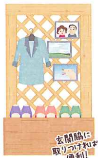
玄関脇に取りつけられ便利!