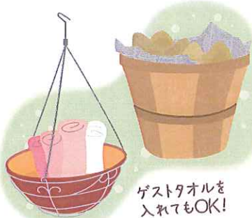
ゲストタオルを入れてもOK!

ワイヤーのハンギング用の鉢受けならタオルをたたんでざっくり入れて洗面所に吊り下げてかわいいですよ！