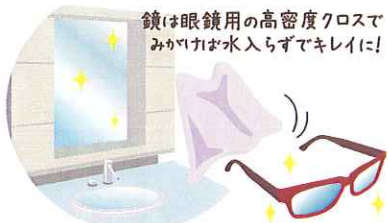
鏡は眼鏡用の高密度クロスでみりいて水アカをキレイに！

水栓金具も水アカなどで汚れやすいですね。やわらかい布などで拭き、週に1回はクレンザーでみがきましょう。 洗面カウンターは乾拭きで十分ですが、キャビネット内部は湿気がこもりがちになるので、時々扉を開けて換気しましょう。鏡は、ガラス用洗剤がおすすですが、シェービングフォームを付けて拭くとくもり止め効果があります。