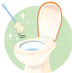
便座の汚れがひどい部分は洗剤をかけた後から置いて後にブラシやスポンジで軽くこすり落としましょう。

脱臭カセットにホコリがつくと脱臭効果の低下に。吸込口のホコリを掃除機で吸い、歯ブラシで詰まりを取り除くといいでしょう。換気扇も同様です。日ごろからルーバーのホコリを吸い取り、時々は中のファンも掃除しましょう。 床は汚れたらすぐ拭き取れば、洗剤を使わなくても十分キレイを保てます。