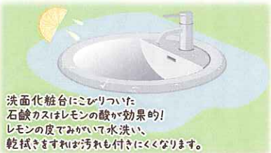
洗面化粧台にこびりついた石鹸カスはレモンの酸が効果的！レモンの皮でみりいて水洗い、乾拭きすれば汚れも付きにくくなります。

クレンザー代わりに使うといいでしょう。取れにくい汚れは洗面ボウルに水を張り、酸素系漂白剤を溶かして一晩置いて汚れを緩めてから落としましょう。その後の水洗いと乾拭きも忘れずに。また、ヘアキャッチャーも、髪の毛やゴミを取り除いたら歯ブラシなどで細かいところをお掃除しましょう。排水管の悪臭は、排水口と周囲に中性洗剤をたっぷりとかけ、お湯を注ぎしばらく待った後にたわしなどで掃除し、ホースで勢いよく水を流せばスッキリしますよ。