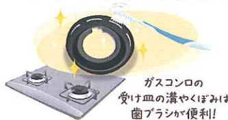
ガスコンロの受け皿の溝やくぼみは歯ブラシが便利！

◆加熱機器 ◆ガスレンジの場合：使用後はお湯拭きを。五徳は台から外して台所用洗剤かクレンザーで磨きましょう。ガスレンジの受け皿は台所用洗剤をうすめたお湯につけ置き後に磨きましょう。パーナーはワイヤブラシでこすり、穴の目詰まりもキリなどで取り除きましょう。