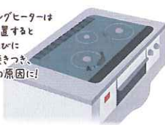
IHクッキングヒーターは汚れを放置すると調理のために汚れが焼きつき、コゲつきの原因になります。

◆IHクッキングヒーターの場合：調理後、余熱があるうちに絞った布で拭きましょう。クリームクレンザーや固いスポンジは表面のフッ素コーティングがはげるので避けましょう。油污れはお湯で薄めた台所用中性洗剤をやわらかいスポンジに含ませて拭き、水気もしっかりと拭き取りましょう。IHクッキングヒーターは汚れを放置すると調理のために汚れが焼きつき、コゲつきの原因になります。ご承知ください。