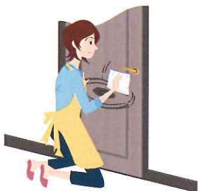
アルミ製、鋼製の玄関ドアは、住居用中性洗剤の薄めたものでお手入れ後、仕上げの乾拭きも忘れずに。