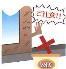
ツヤ消し仕様のサッシは色ムラのおそれがあるのでワックスは塗らないで！

ら吸いましょ。ホコリも良く取れ、網のたるみ防止にも。汚れがひどいときは住居用洗剤のうすめ液を使い、ブラシやスポンジで網戸を両側からたたかようにして汚れを落とし、水洗いをして陰干しを。ちなみに、立て掛けながらお手入れすると網が押されてゆるみや破れのもとになるので、網の張つてある面を下に寝かせてから行いましょ。