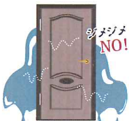
木製ドアは劣化を防ぐためにも湿気を残さないようにしましょう。

●アルミ製ドア・引き戸：普段のお手入れは週に一度、やわらかい布で水拭きましょ。半年に一度は、住居用洗剤のうすめ液で拭けば、さらにキレイになります。